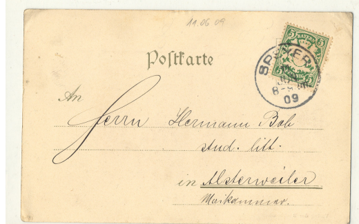
(Postkarte aus dem Jahr 1909)